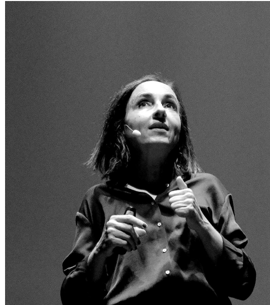
Lumen Show, oct. 2025