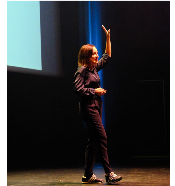
Lumen Show, oct. 2025