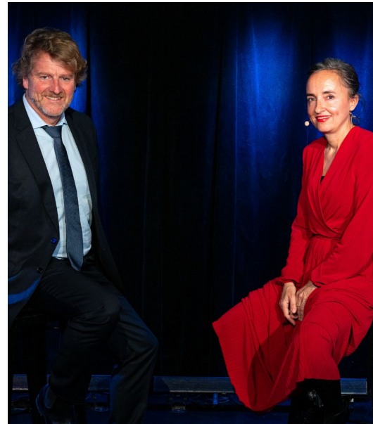
Itw, nov. 2023