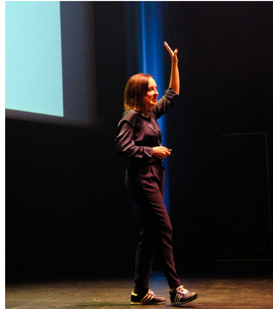
Lumen Show, oct. 2025