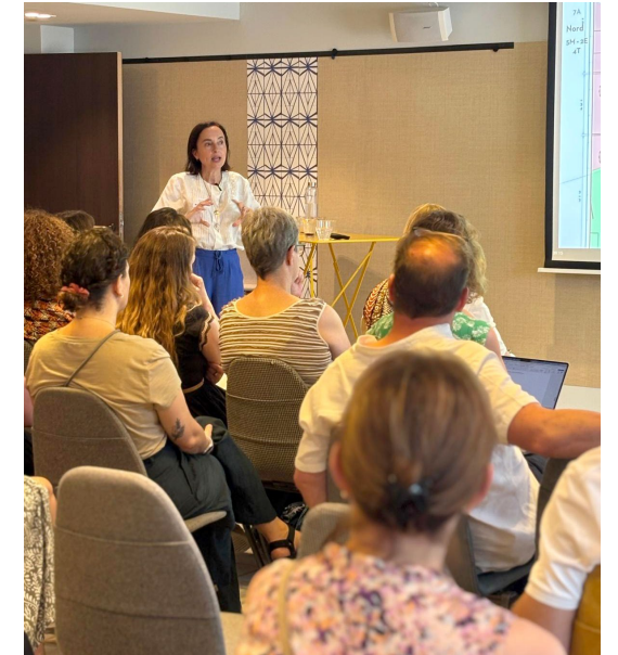
Chateauform', juillet 2025