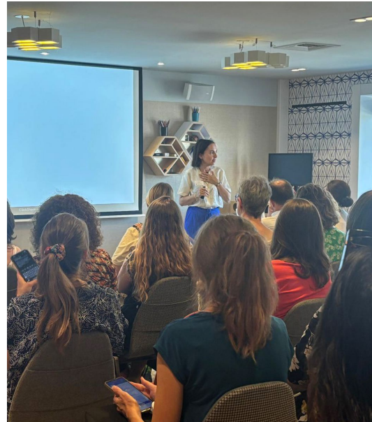
Chateauform', juillet 2025

Quand l'histoire bloque la vie de l'entreprise